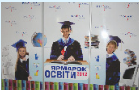
Відділ реклами та зв'язків