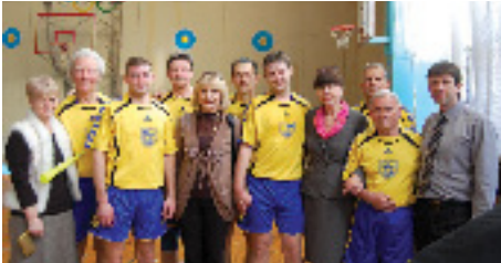
Інформацію підготовлено Відділом реклами ЗДІА

25 квітня в спортивному залі ЗДІА відбувся святковий турнір з волейболу між збірними командами викладачів, студентів ЗДІА та збірною командою міського Управління МНС у Запорізькій області.