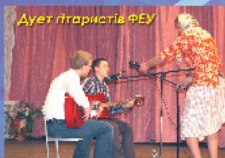
Дует гітаристів ФЕУ