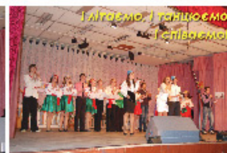
І літаємо, і танцюємо, і співаємо!