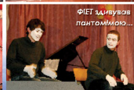
ФІЕТ здивував пантомімою...