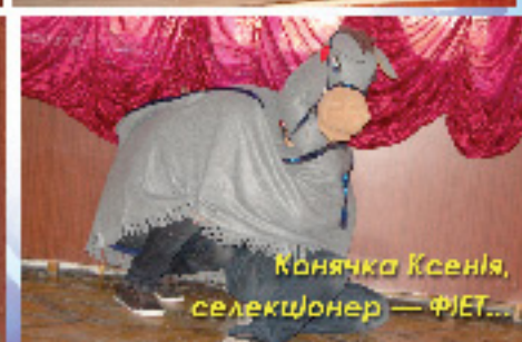
Княчка Ксенія, селекціонер — ФІЕТ...