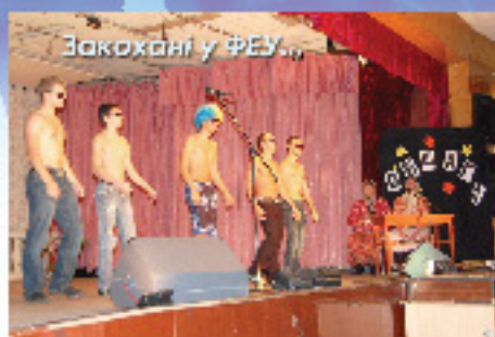
Закохані у ФЕУ...