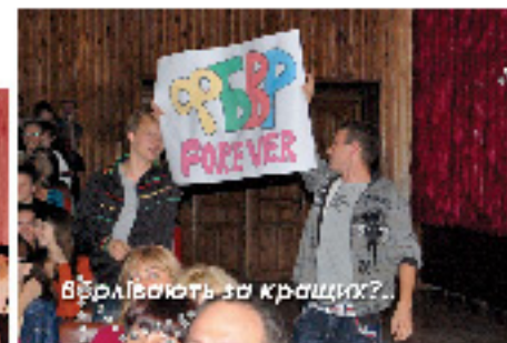
Варляють за краси?...