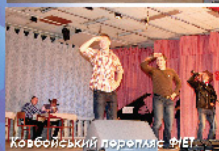
Ковбойський дорепляс ФІЕТ