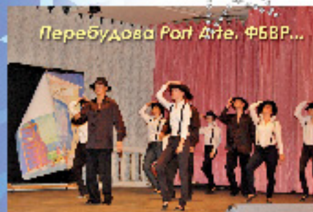
Перебудова Post Ate. ФБВР...