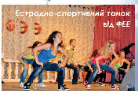
Естрадно-спортивний танок від ФЕЕ