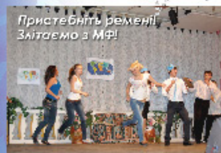
Пристебніть ремені! Злітаємо з МФ!