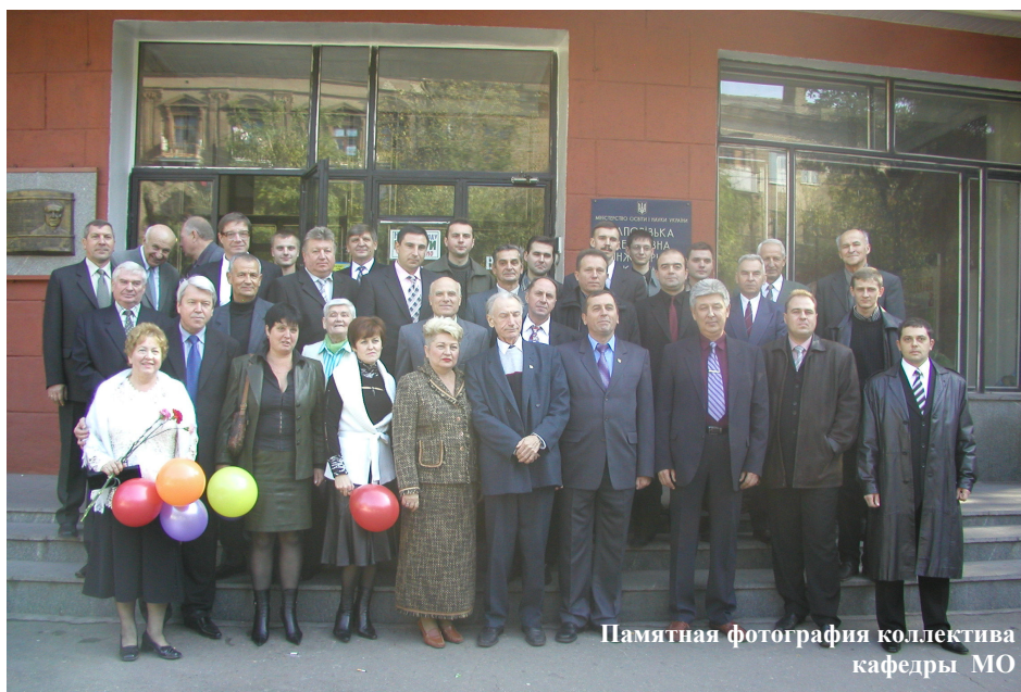
Памятная фотография коллектива кафедры МО