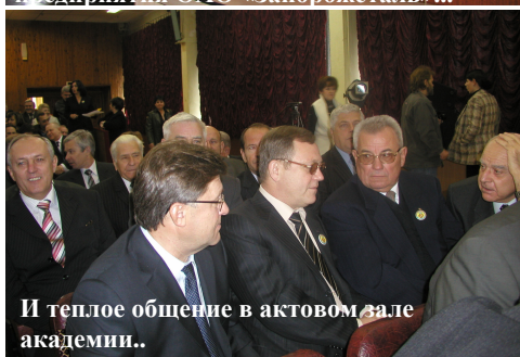
И теплое общение в актовом зале академии..