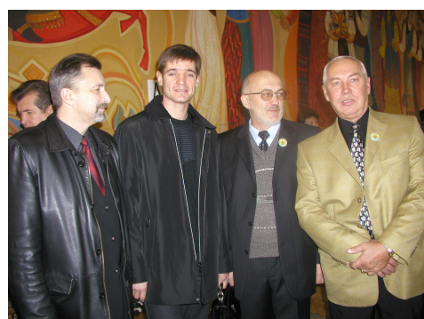
И гордость академии — выпускники прошлых лет...