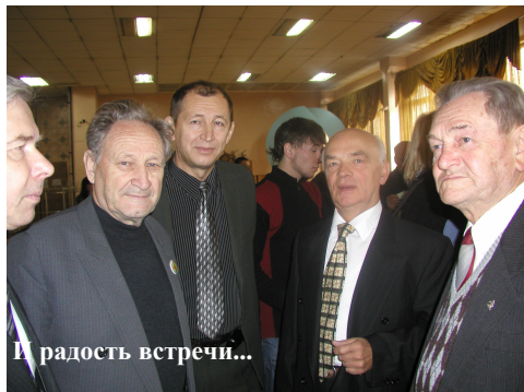
И радость встречи...