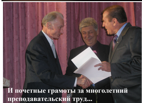
И почетные грамоты за многолетний преподавательский труд...