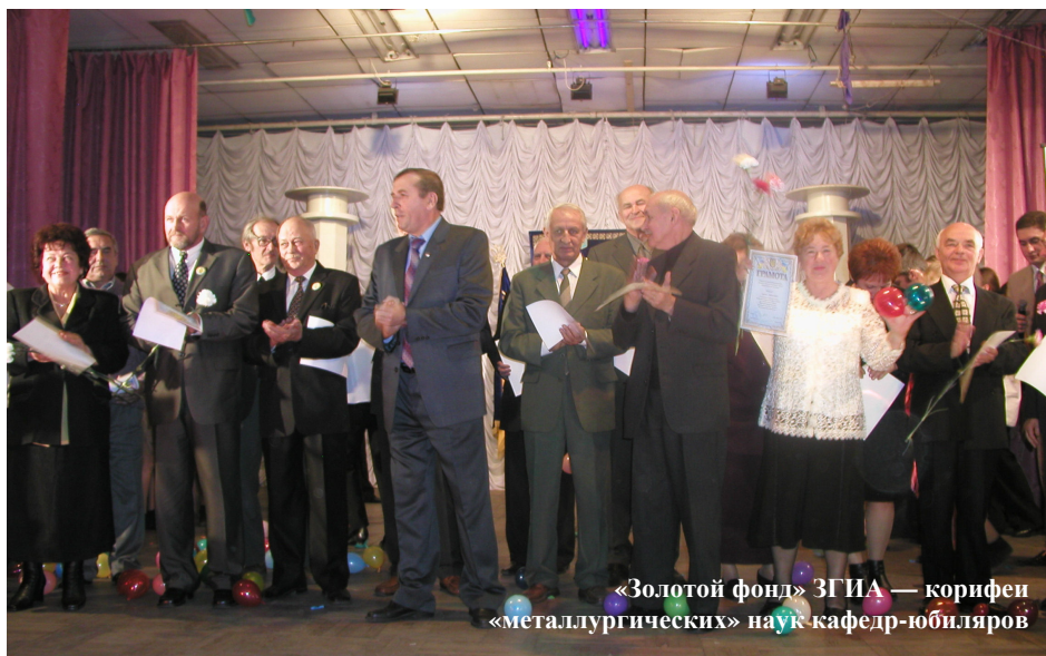
«Золотой фонд» ЗГИА — корифеи «металлургических» наук кафедр-юбиляров