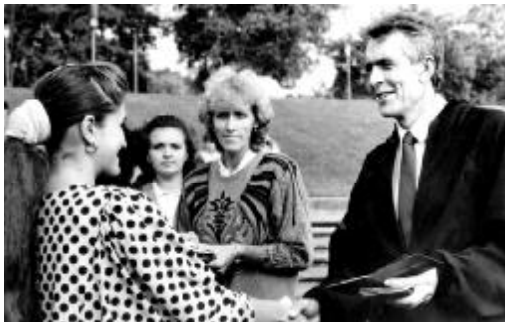
Посвячення у студенти, 1992 р.

висококваліфіковані викладачі, забезпеченість навчально-методичною літературою та добре оснащена матеріально-технічна база. Навчальний процес здійснюють 57 викладачів: з них 7 професорів і 22 доценти, серед яких є академіки профільних та міжнародних академій.