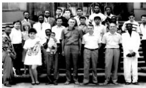
Випуск іноземних студентів, 1993 р.

Факультет зміцнює надбані позиції та працює на перспективу.