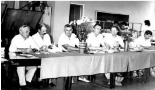
Засідання Державної екзаменаційної комісії, 1992 р.