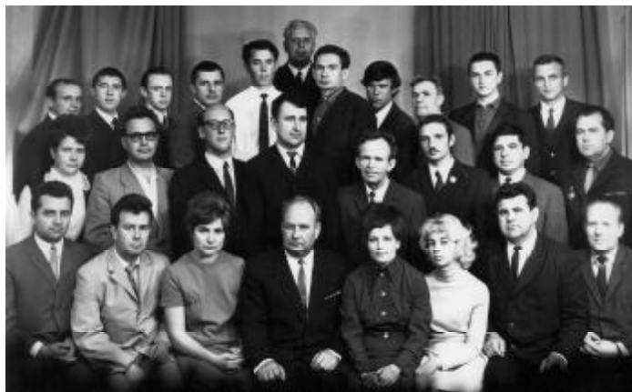
Колектив кафедри, 1972 р.

З того часу підготовка фахівців з автоматизації остаточно набуває сучасної