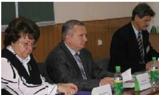
На науковій конференції перший заступник голови Запорізької обласної державної адміністрації О. П. Бережний

Навчальну, наукову та виховну діяльність кафедри відзначено Почесними грамотами МОНУ, облдержадміністрації, мера м. Запоріжжя. Кафедра постійно наполегливо працює над удосконаленням навчально-виховної, методичної та наукової діяльності.