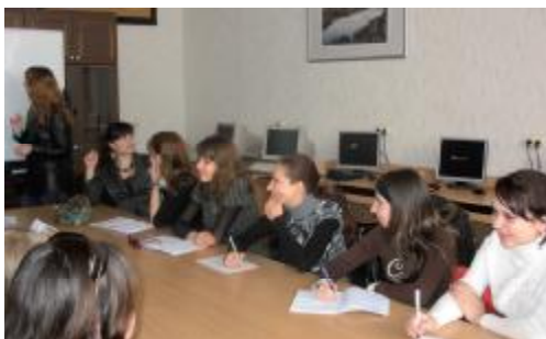
Семинар школи бізнесу “Твій успіх”

Велика увага приділялась створенню матеріально-технічної бази факультету. У 2003 р. з метою підвищення ефективності організації навчального процесу було прийнято рішення створити на базі трьох факультетів (економіки і менеджменту, заочного факультету систем управління і інформаційних технологій та заочного інженерно-економічного факультету) факультет економіки підприємства (ФЕП) та покласти на ФЕП, починаю-