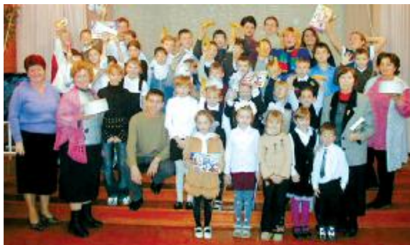
Добродійна акція для дітей з вадами зору. Школа-інтернат № 5 м. Запоріжжя, грудень 2005 р.

2007–2008 н.р. для факультету економіки підприємства став знаменним календарними подіями: кафедрі економіки підприємства виповнилося 40 років, кафедрі українознавства – 10, а факультету – 5 років. Тож, незважаючи на „юність”, факультет сьогодні має прекрасні традиції, які свято шанує і примножує. 1 вересня 2009 р. цей факультет ввійшов до складу наново організованого факультету економіки та управління.