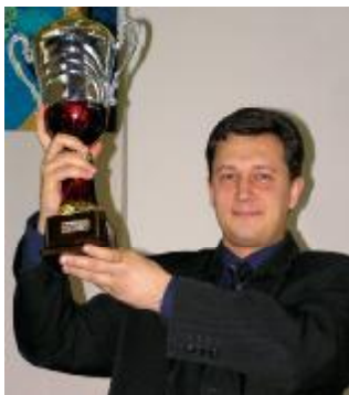
Перемога в спартакіаді ЗДІА серед збірних команд факультетів в комплексному заліку, травень 2006 р.

потенціал професорсько-викладацького складу ФЕП – це фундамент і підґрунтя якісного навчання студентів. На кафедрах факультету працюють понад 100 високопрофесійних викладачів, з яких більше 50% є докторами та кандидатами наук. Під їх керівництвом у процесі навчання студенти проводять науково-дослідні роботи, беруть активну участь у студентських науково-практичних конференціях ЗДІА та інших ВНЗ України.