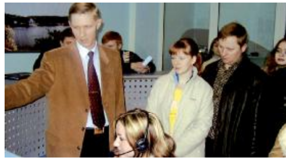
День відкритих дверей на факультеті (навчально-тренувальний центр банківських систем кафедри ЕК, квітень 2007 р.)