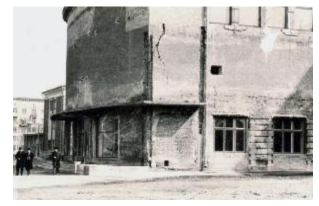
Остання руїна часів ВВВ... Тут буде головний вхід до ВНЗ

У квітні 1964 р. Рада Міністрів СРСР прийняла постанову "Про дальше поліпшення вищої середньої спеціальної заочної та вечірньої освіти". Відповідно до цієї постанови значно розширювались можливості для зміцнення матеріальної бази ВНЗ, які забезпечують підготовку спеціалістів за вечірньою або заочною системою, зокрема, за рахунок матеріальної допомоги підприємств у оснащенні лабораторій, кабінетів, проведення капітального будівництва тощо.