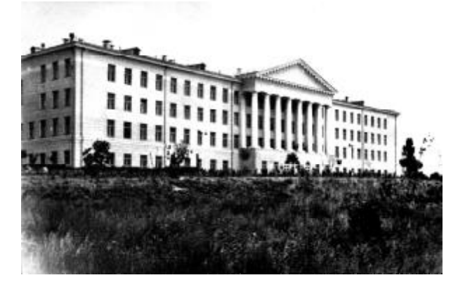
Запорізький металургійний технікум — тут були розташовані декілька перших приміщень ЗВФ ДМетІ

Відлік історії Запорізької державної інженерної академії ведеться від 10 листопада 1959 р. У цей день Міністерством вищої і середньої спеціальної освіти УРСР був